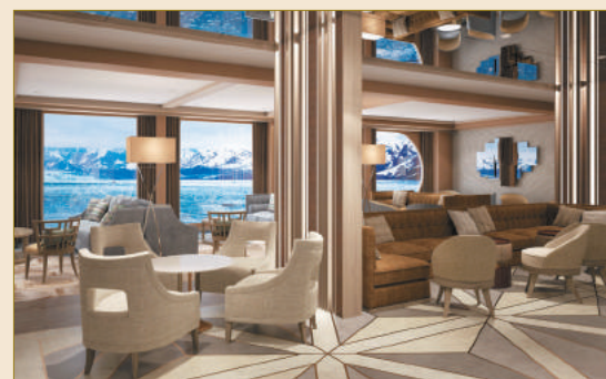
オブザベーション・ラウンジ / イメージ

全客室の72%がバルコニー付で、南極に就航しているどの客船よりも広い25㎡以上の客室。また、ゴム長靴や防寒具を収納できるロッカーが備わったマッドルームも完備し、快適な南極旅行をお楽しみいただけます。下船口は4か所で、短時間に素早く下船できます。世界最高級レベルの探検客船で太古の大自然と野生動物の楽園・南極を満喫いただけます。