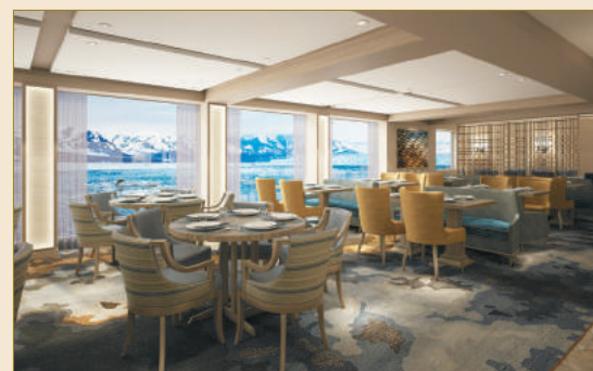
レストラン / イメージ