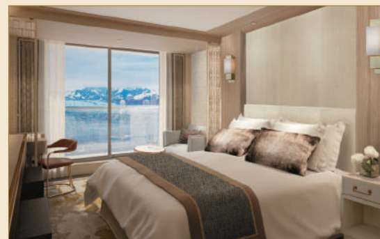
客室 / イメージ

写真インストラクターによる写真撮影プログラム、クリニック、格納式フィンスタビライザー1対、バー