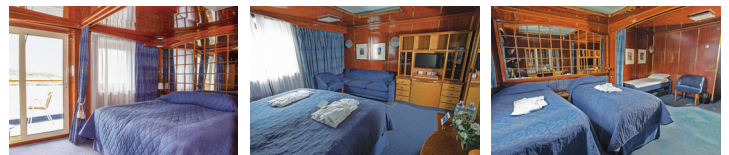
ペントハウススイート/イメージ