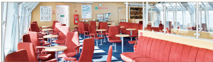
展望ラウンジ/イメージ