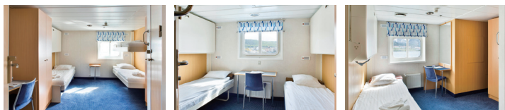
トリプル客室の一例/イメージ