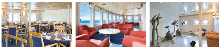
ダイニング・ルーム/イメージ