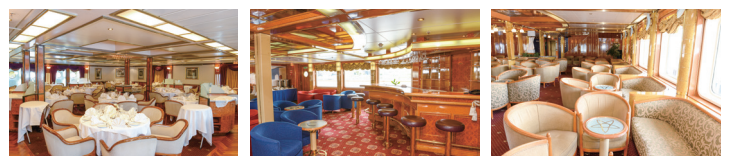
レストラン/イメージ